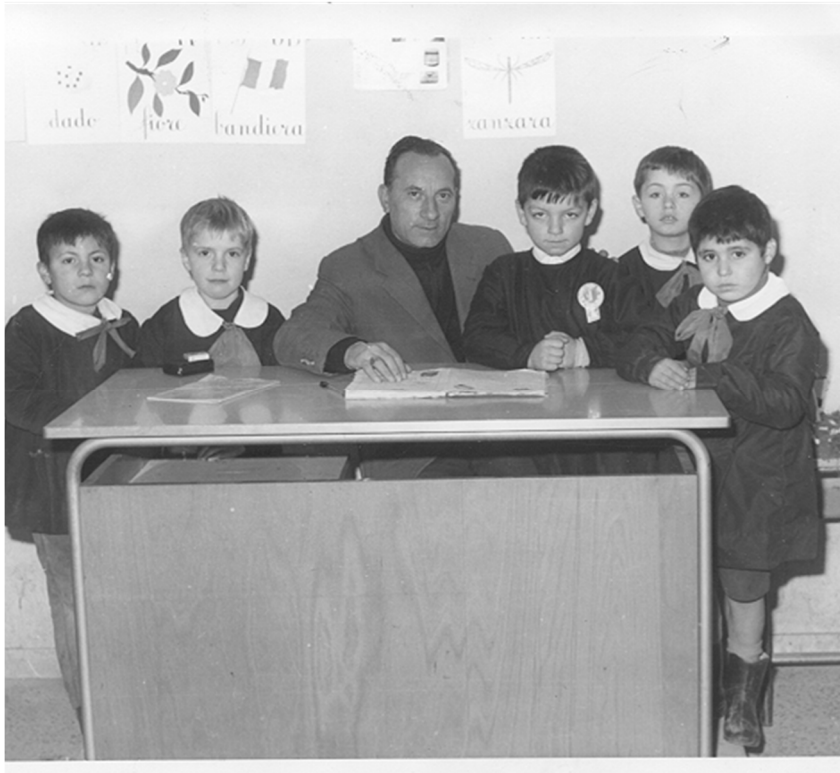
I miei alunni