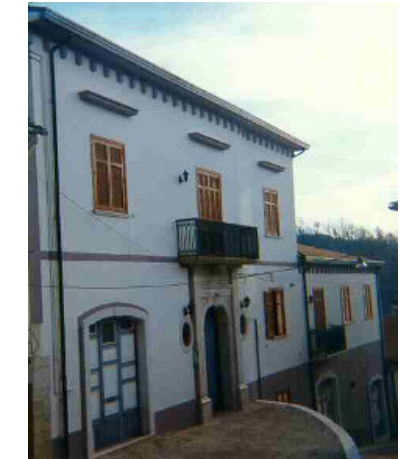
La tua Casa